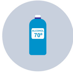
Productes que continguin almenys un 70% d'alcohol