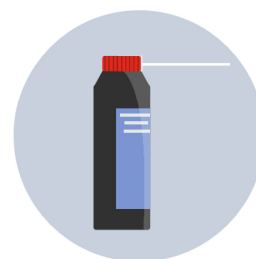
Esprais desinfectants específics per a l'aire condicionat (Hauràs de ventilar l'habitacle després d'usar-los)