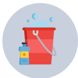
Aigua i sabó abundants