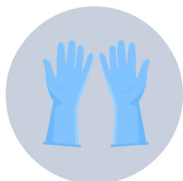
Guants d'un sol ús