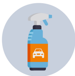
Productes comercials específics per a la desinfecció de l'interior del vehicle