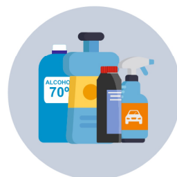
Productes de desinfecció